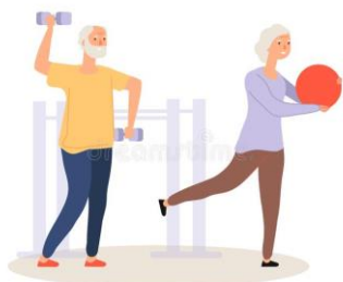
Exerciții fizice sau sport