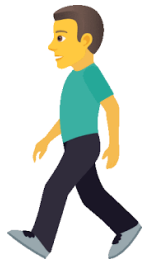
Mers pe jos