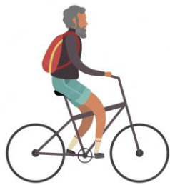
Mers cu bicicleta